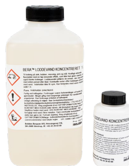
Anbefalet flusmiddel BERA™ Loddevand Koncentreret